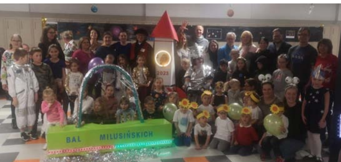
25.02.2023 – Kosmiczny Bal Milusińskich

Uczniowie i nauczyciele z wielką radością wrócili