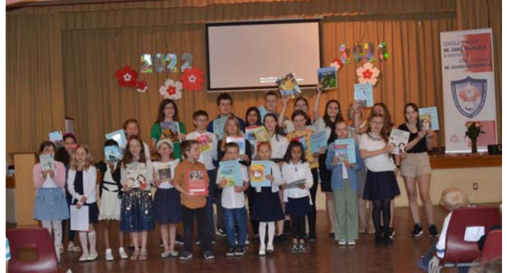
Laureaci szkolnego finału konkursu recytatorskiego, pod hasłem "Fredro i przyjaciele, czyli bajki i wiersze z morałem", otrzymali dyplomy i nagrody książkowe ufundowane przez konsulat RP w Montrealu.

do zajęć w klasach. Podobny entuzjazm towarzyszył rodzicom. Z zapałem włączyli się do działalności na rzecz szkoły i powrócili także do swoich zajęć sportowych podczas szkolnych sobót (siatkówka i gimnastyka). W każdą sobotę zorganizowana była kawa dla rodziców czekających na swoje dzieci, podczas przerwy działał kiosk z ciasteczkami, dyżurowała biblioteka szkolna a komunikację