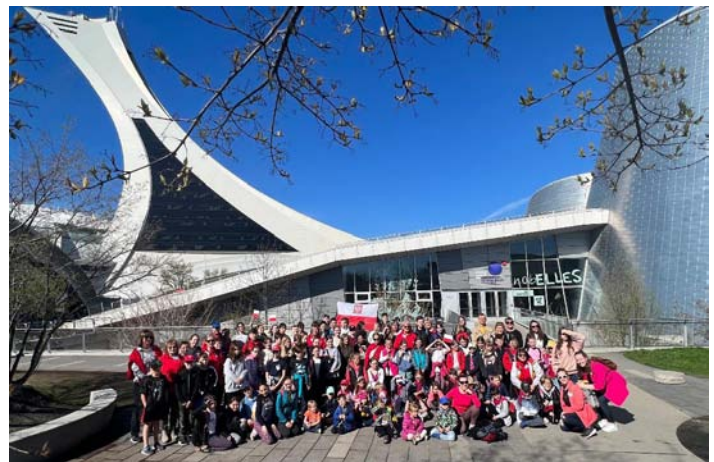
6.05.2023 – Przed Planetarium – wycieczka szkolna

do zajęć w klasach. Podobny entuzjazm towarzyszył rodzicom. Z zapałem włączyli się do działalności na rzecz szkoły i powrócili także do swoich zajęć sportowych podczas szkolnych sobót (siatkówka i gimnastyka). W każdą sobotę zorganizowana była kawa dla rodziców czekających na swoje dzieci, podczas przerwy działał kiosk z ciasteczkami, dyżurowała biblioteka szkolna a komunikację