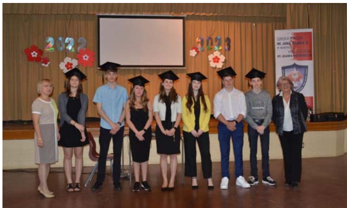
13.05.2023 – Absolwenci 2023 i ich tegoroczne nauczycielki

szkolna. Jedna z mam została nawet laureatką konkursu Polonijny Rodzic na 6. Na potwierdzenie, że rok 2022-2023 był to udany i