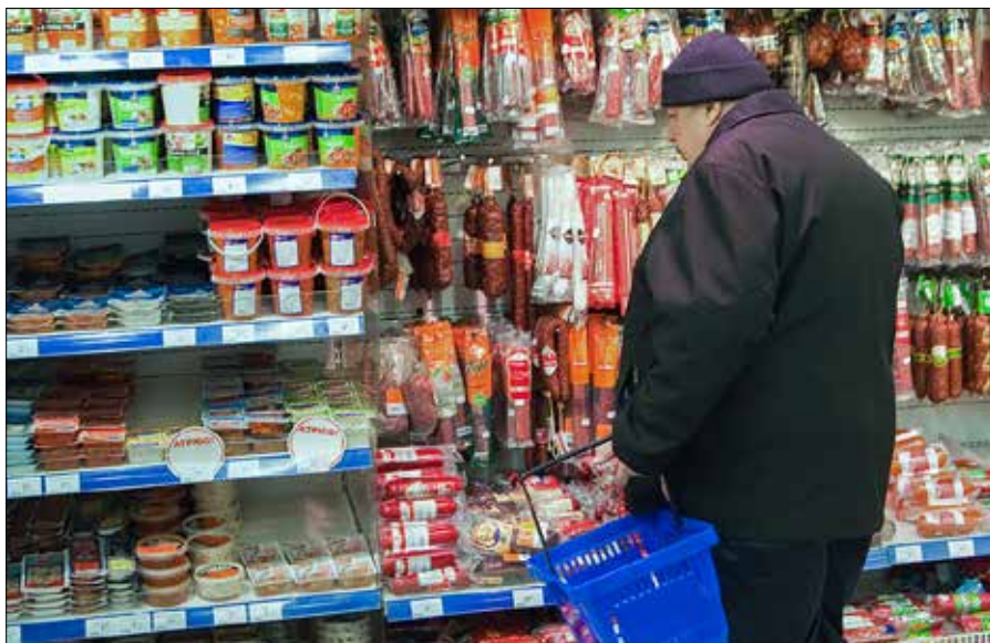
Jak dotąd ceny spadają mniej niż handlowcy zyskują z podwyżek cen...

Na początku tego roku konsumenci mają zobaczyć pauzę cenową. W pierwszym kwartale br. ma nastąpić tzw. „przestój techniczny” – odnowienie cenowych relacji między producentem a sprzedawcą. Oznacza to, że biznes w zasadzie będzie, transakcje będą, zyski pewnie też będą, może trochę niższe, ale w porównaniu do pierwszego i drugiego kwartału zeszłego roku, ma być spadek cen kosztem kompromisów. ■