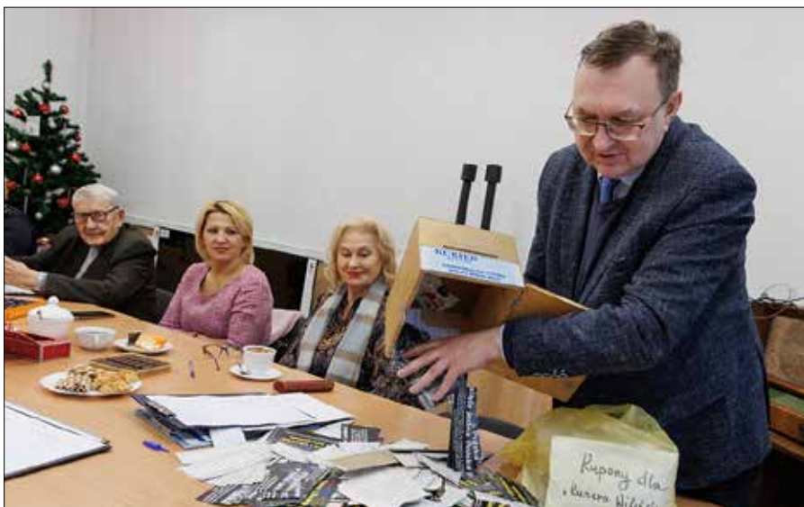
■ W poniedziałek, 9 stycznia, wyłoniono zwycięzcę plebiscytu „Polak Roku 2022”