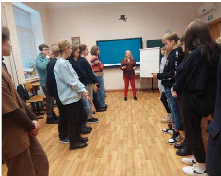
W symulacjach konfliktów, każdy wystąpił w roli strony konfliktującej, jak i w roli mediatora