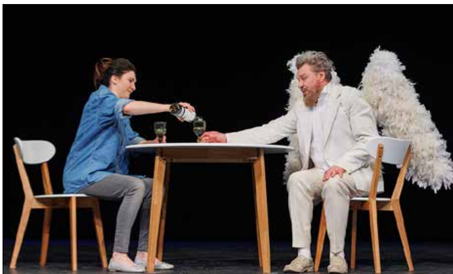
■ Amhiel próbuje odwieść kobietę od zamiaru targnięcia się na własne życie