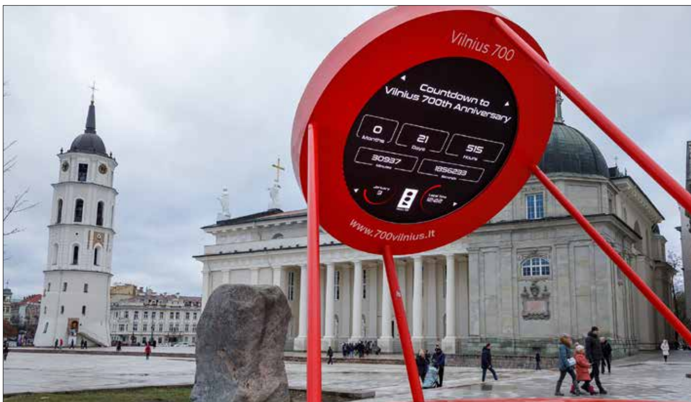
■ Symboliczny zegar na placu Katedralnym odliczający dni do 700-lecia miasta