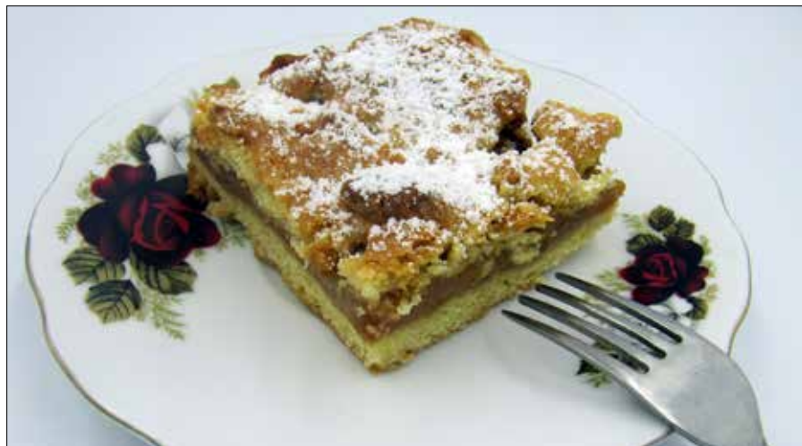
■ Szarlotka z tartymi jabłkami

Przygotować jabłka: obrać je i zetrzeć na tarce o dużych otworach,