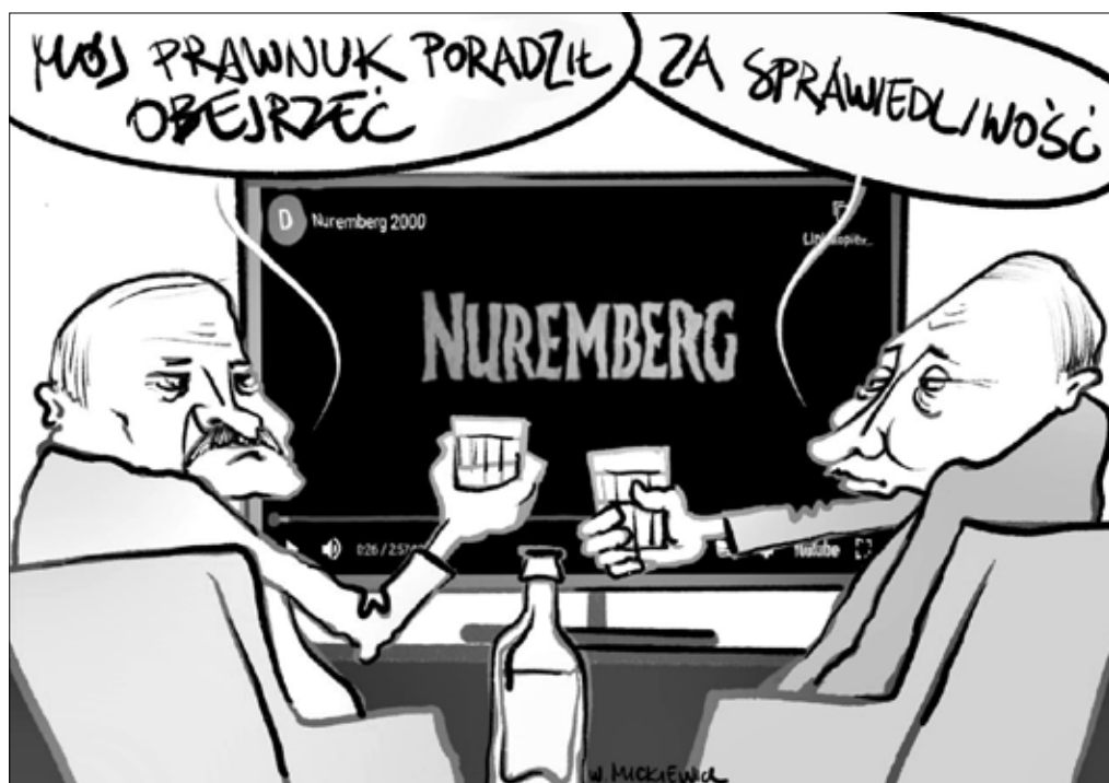
■ Rys. Władysław Mickiewicz