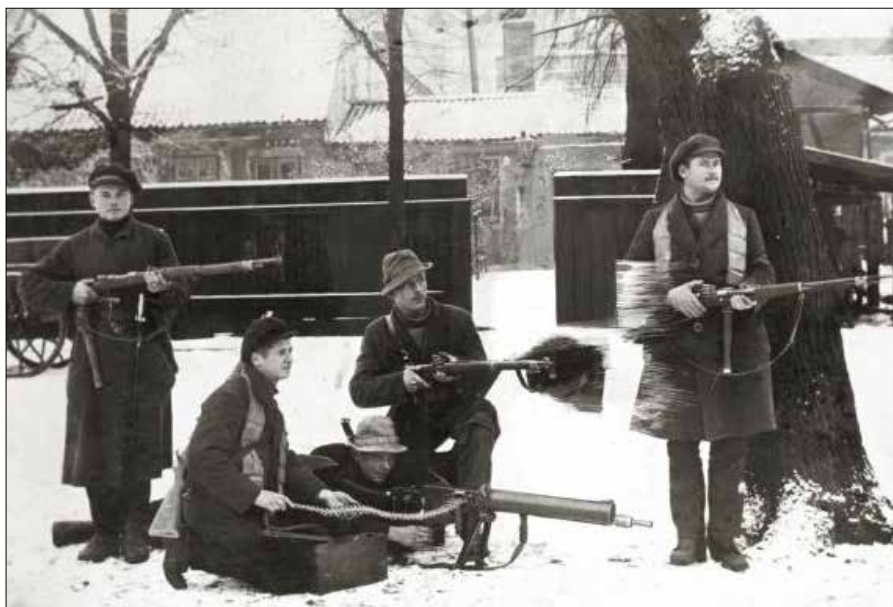
Powstańcy w Kłajpedzie, 1923 r.

— Litwini zdecydowali się na zorganizowanie powstania, które faktycznie pozorowało, że miejscowa ludność dąży do połączenia z Litwą. Powstanie rozpoczęło się 10 stycznia. Przed planowanym rozpoczęciem działań z Litwy na te tereny przedostawały się niewielkie grupy mężczyzn, po 6-10 osób, które nie zwracały na siebie uwagi władz. Byli