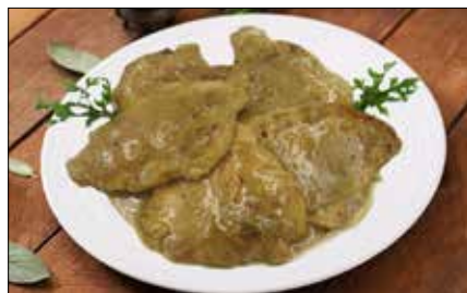
■ Fot. autorka

• 700 g schabu • 1 cebula • 3 łyżki mąki pszennej • 1/2 łyżeczki słodkiej papryki • 1 liść laurowy • 2 ziela angielskie • sól • pieprz • tłuszcz do smażenia