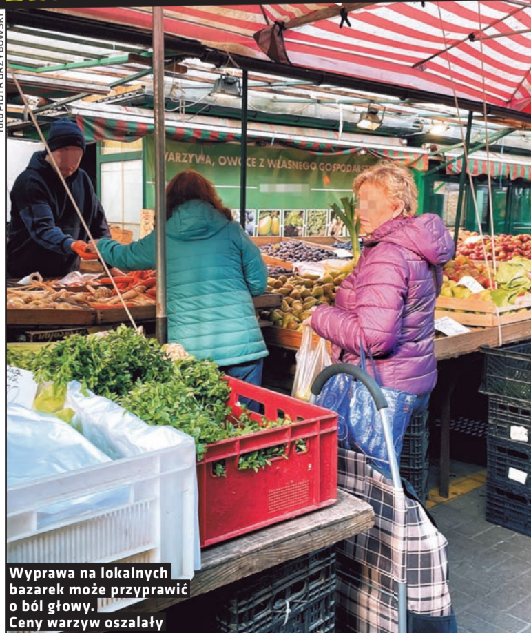
Wyprawa na lokalnych bazarek może przyprawić o ból głowy. Ceny warzyw oszalały