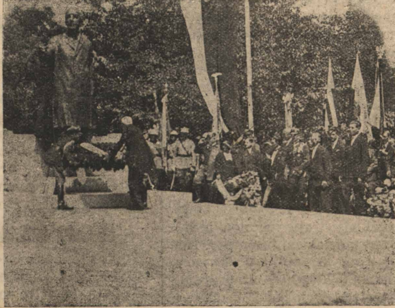
Zdjęcie powyżej: Pan Prezydent składa pierwszy wieniec.