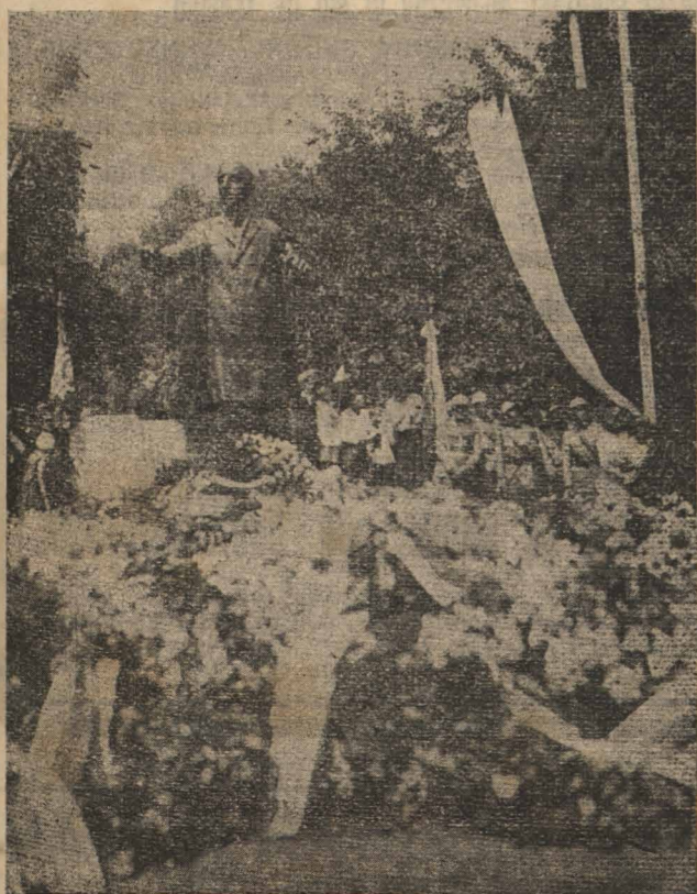
Po złożeniu przeszło trzystu wieńców u stóp pomnika Wilsona.