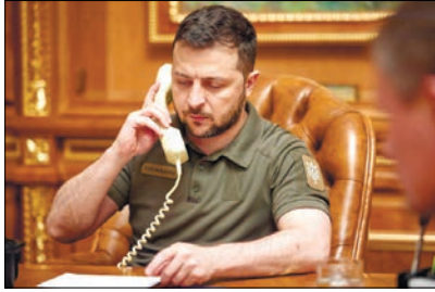
przygotowań do lipcowego Szczytu

"Prezydent Andrzej Duda odbył rozmowę telefoniczną z prezydentem Ukrainy Wołodymyrem Zełenskim, podczas której omówiono ustalenia Szczytu Bukaresztańskiej Dziewiątki w Bratysławie oraz aktualny stan