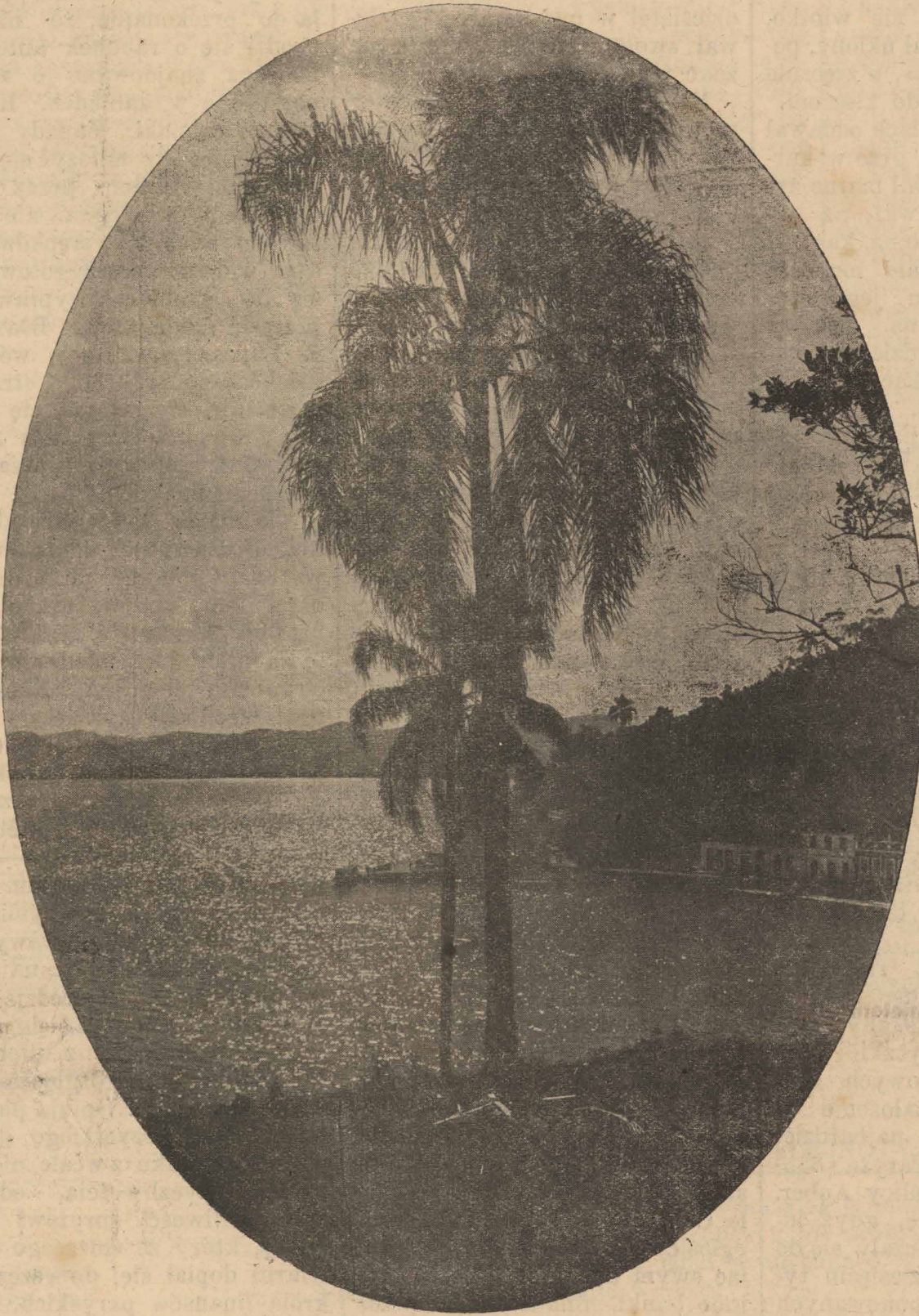
Ilustracja nasza przedstawia majestatyczny okaz palmy w uroczej miejscowości GUARATUBA na wybrzeżu Atlantyku.