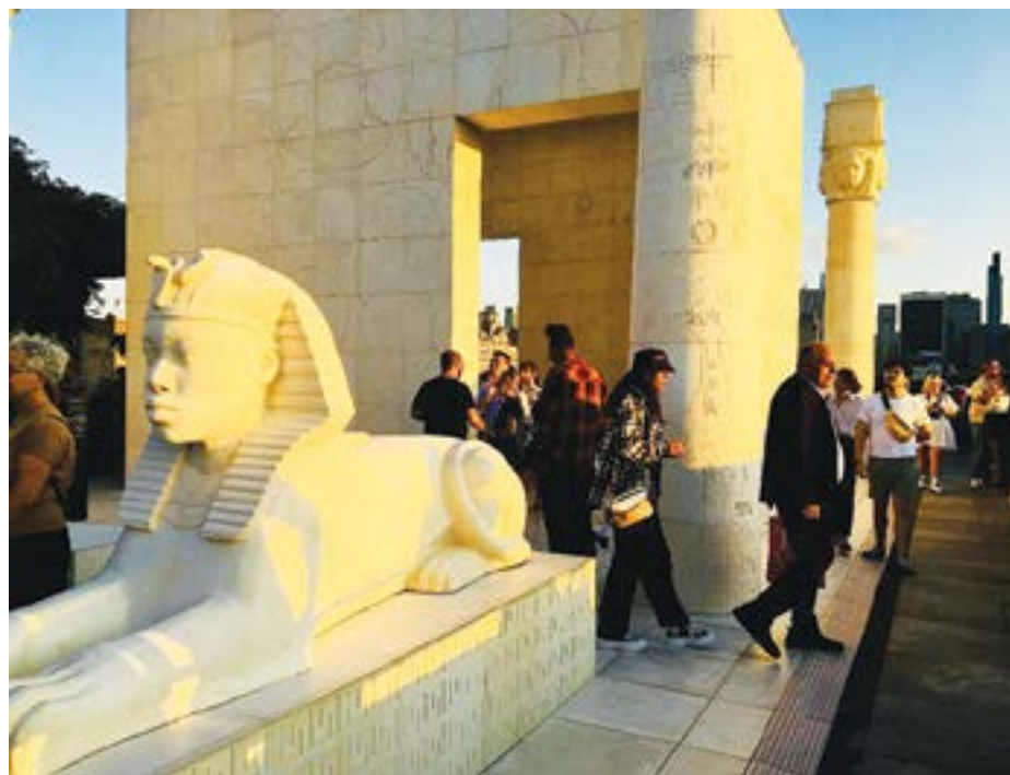
Część instalacji na dachu Metropolitan Museum of Art