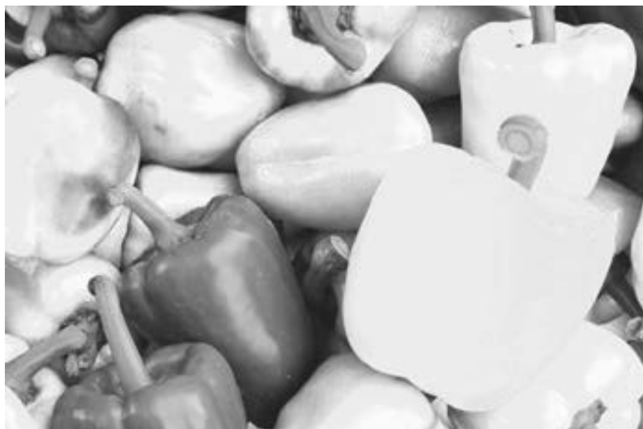
Ma więcej witaminy C od cytryny i mnóstwo antyoksydantów. Kolor ma znaczenie

N ajpopularniejsza papryka jest czerwona - słodka i pękata - ale łatwodostępne są także żółte, pomarańczowe i zielone papryki o tym samym kształcie. Czy różnią się czymś jeszcze, poza kolorem? Która z nich jest najzdrowsza? Sprawdź, którą paprykę warto wybrać, oraz kto powinien unikać tego warzywa.