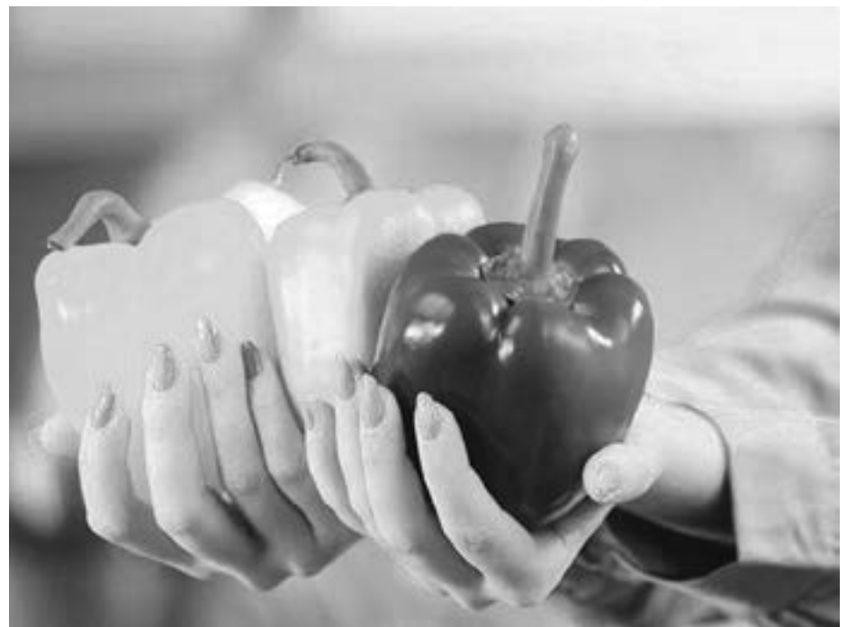
Warzywo zawiera znaczne ilości błonnika, który sprzyja procesom metabolicznym i usprawnia perystaltykę jelit