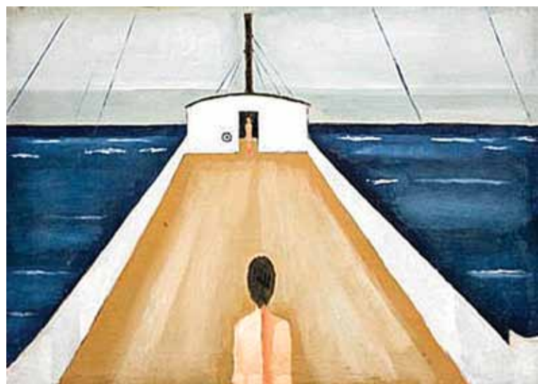
Porwanie Europy (1970)

Dopiero w okresie odwilży w 1954 roku Nowosielski bierze udział w wystawie zbiorowej w warszawskiej Zachęcie,