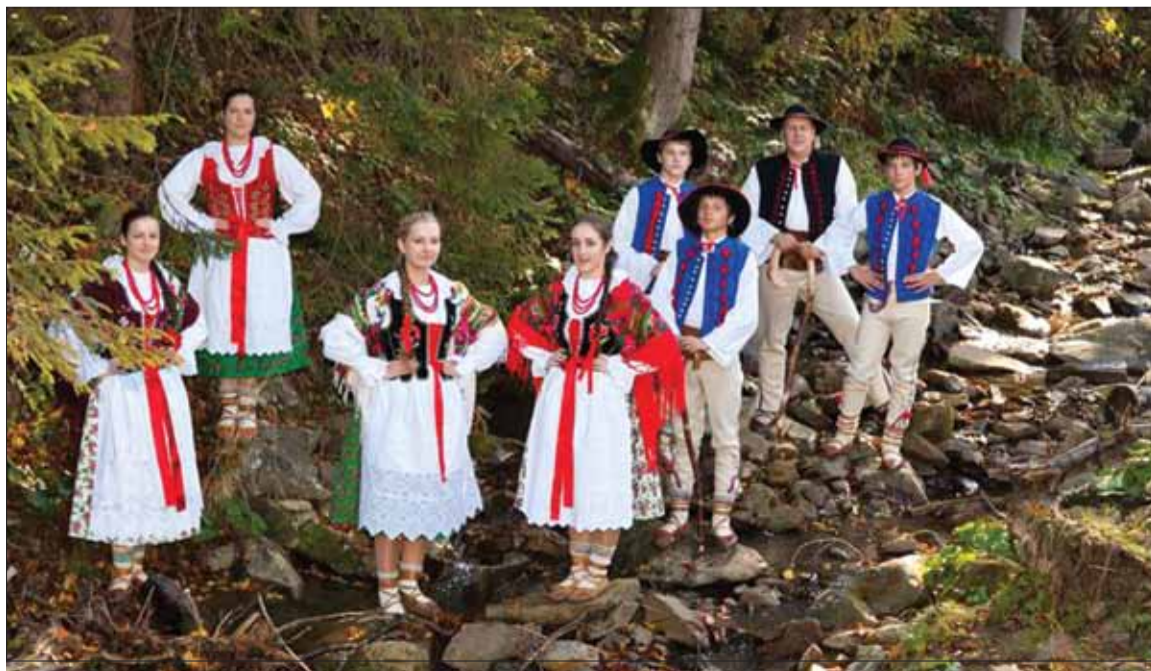
Członkowie zespołu Żywczanie ubrani w strój Górali Żywieckich