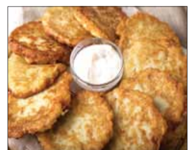
Moskole - placki, zapiekane na blasze lub patelni, które robi się z ugotowanych i utłuczonych ziemniaków z dodatkiem mąki i jajek