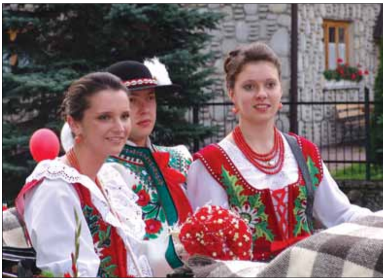
Na góralskim weselu drużny porwały Pana Młodego i usadowiły do pierwszej dorożki

Zakopane. Odwiedzając to miasto, na każdym kroku możemy spotkać takie elementy folkloru jak: stroje, gwara i kuchnia.