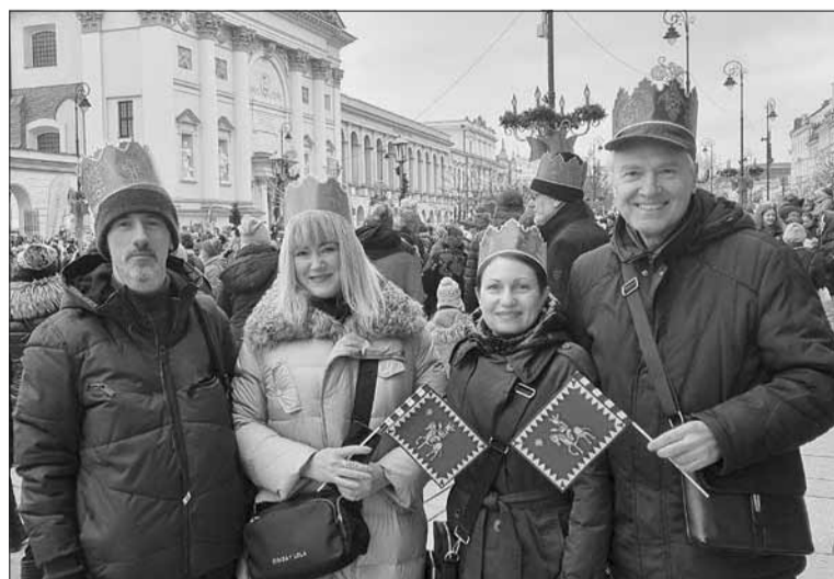
Polacy z Kijowa uczestniczyli w świętowaniu Trzech Króli na Placu Zamkowym w Warszawie

Biskup Janocha zwrócił się również po ukraińsku do licznie zgromadzonych w Warszawie ukraińskich matek z dziećmi. „Życzymy wam i waszej Ojczyźnie pokoju mocniejszego od wojny. Życzymy wam i waszej Ojczyźnie nadziei, która jest mocniejsza od śmierci. Chwała Ukrainie” – podkreślił duchowny. W tym roku w Warszawie kolędowano po polsku i ukraińsku. W ramach poczęstunku rozdawano wigilijne potrawy ukraińskie.