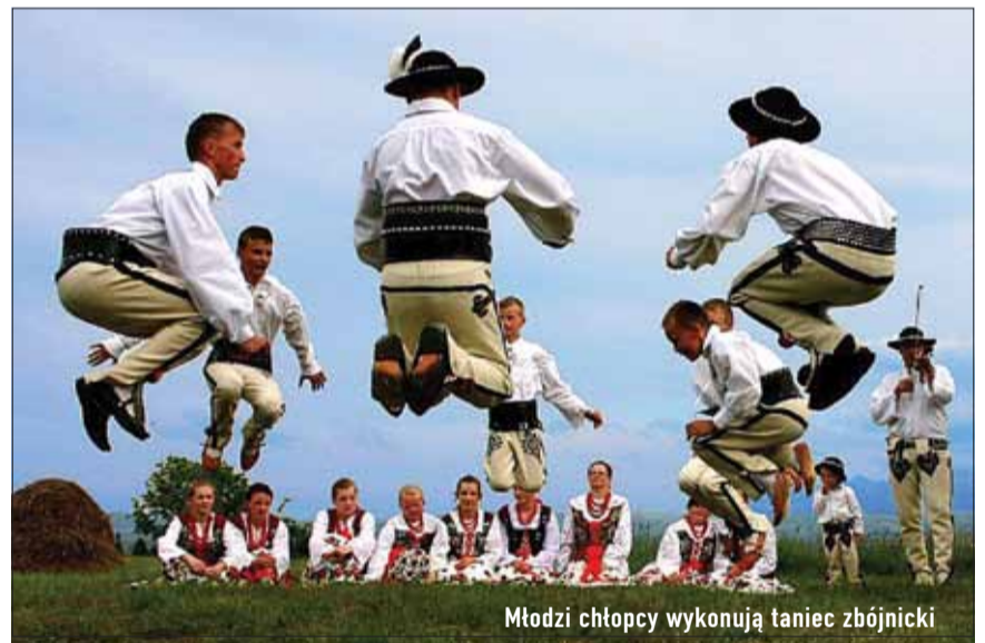
Młodzi chłopcy wykonują taniec zbójnicki

Kapela góralska składała się głównie z czterech grajków. Najważniejszym z nich był tzw. pryma. Jako prowadzący miał za zadanie dobór muzy-