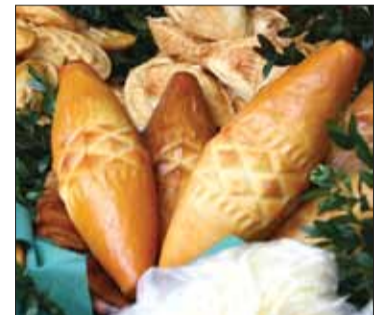
Oscypek to twardy, wędzony, owczy ser wytwarzany głównie na Podhalu.

turystów, nie tylko z całej Polski, ale również z różnych zakątków świata. ■