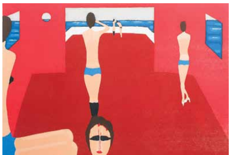
Dziewczyny na statku (1997)