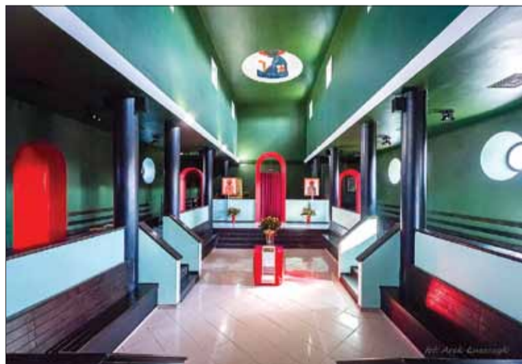
Wnętrze cerkwi w Białym Borze. Artysta stworzył tu niewielką cerkiew greckokatolicką, w której zaprojektował architekturę, wyposażenie wnętrza i wystrój malarski

Zainteresowanie sztuką przejawiał jeszcze w dzieciństwie – jego ojciec po pracy na kolei poświęcał czas malowaniu obrazów, co determinowało w młodym Nowosielskim ciekawość i nowe zainteresowania. Ojciec posiadał również pokaźną bibliotekę, w której było wiele książek z zakresu literatury pięknej, historii, sztuki i religii, do której chętnie zaglądał mały Jerzy.