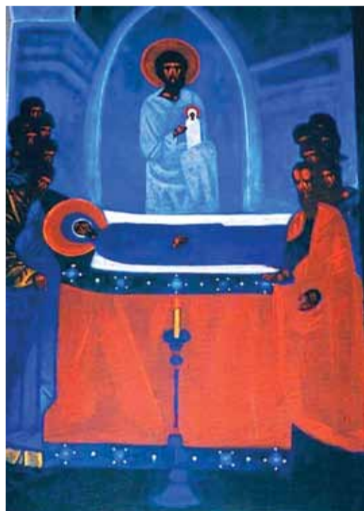
Zaśnięcia Najświętszej Maryi Panny. Polichromia cerkwi greckokatolickiej w Lourdes, Francja. (1984)

Później tylko przez cztery miesiące, z uwagi na chorobę, studiował ikonopisarstwo w unickiej Ławrze Uniowskiej św. Jana Chrzyciela w Uniowie