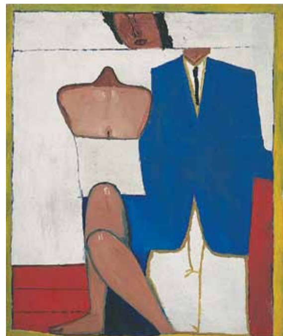
Portret ślubny (1958)