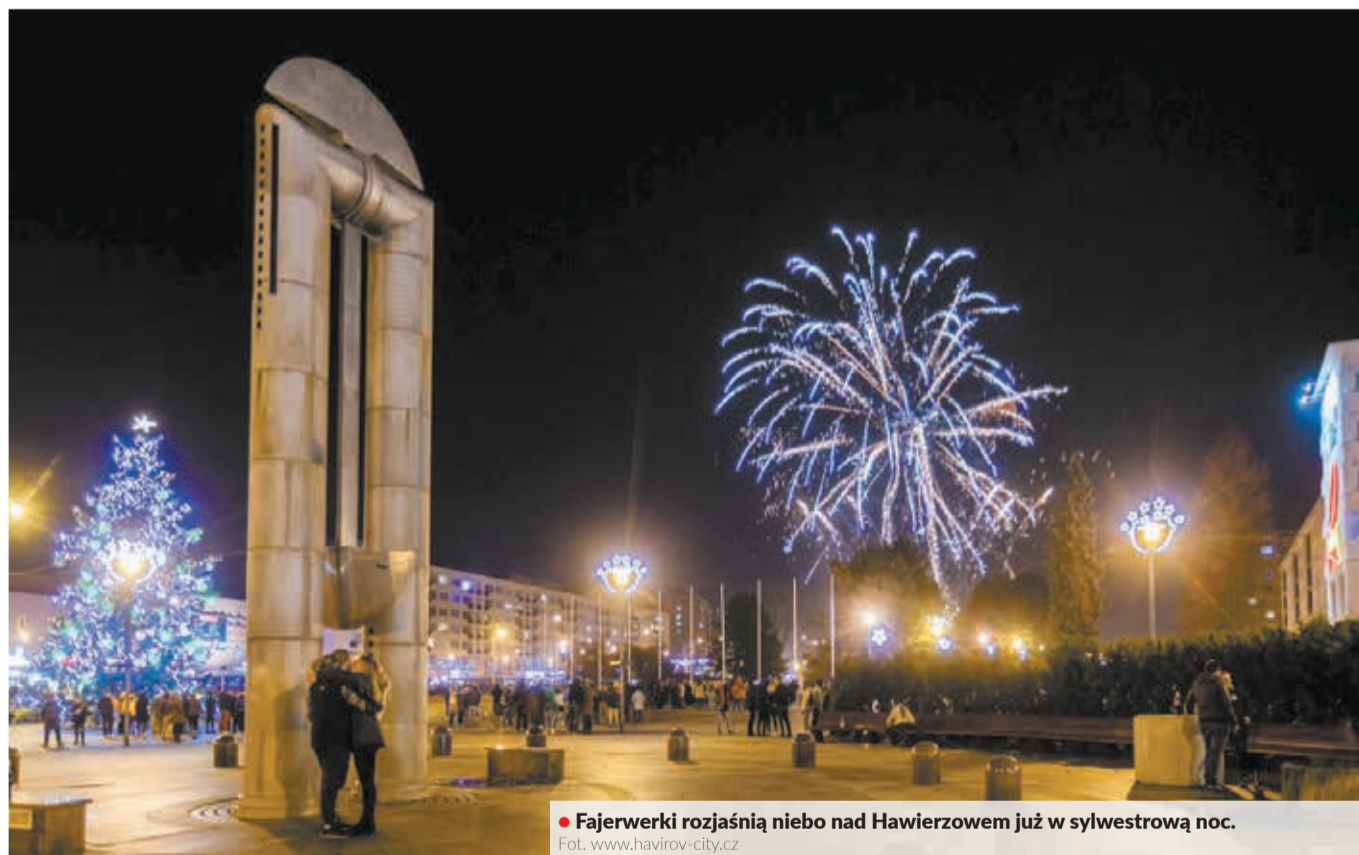
• Fajerwerki rozjaśnią niebo nad Hawierzowem już w sylwestrową noc.

Miastem, które już od wielu lat nie urządza podniebnych świetlnych spektakli, jest Jablonek.