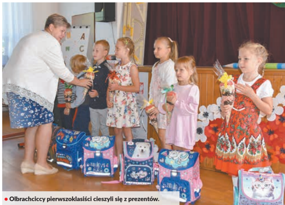
• Olbrachcicy pierwszoklasiści cieszyli się z prezentów.