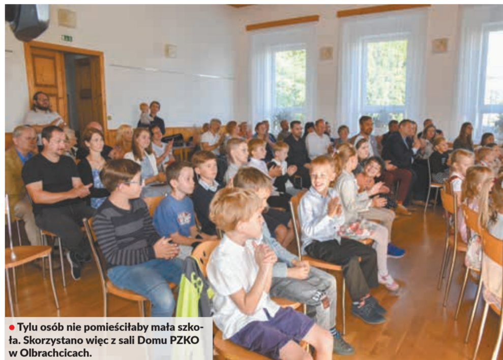
• Tylu osób nie pomieściłaby mała szkoła. Skorzystano więc z sali Domu PZKO w Olbrachcicach.

Zabrzmiął pierwszy dzwonek. Wczoraj w całej Republice Czeskiej rozpoczął się oficjalnie nowy rok szkolny 2022/2023. Uczniów i nauczycieli witały w swoich progach również szkoły podstawowe i średnie z polskim językiem nauczania.