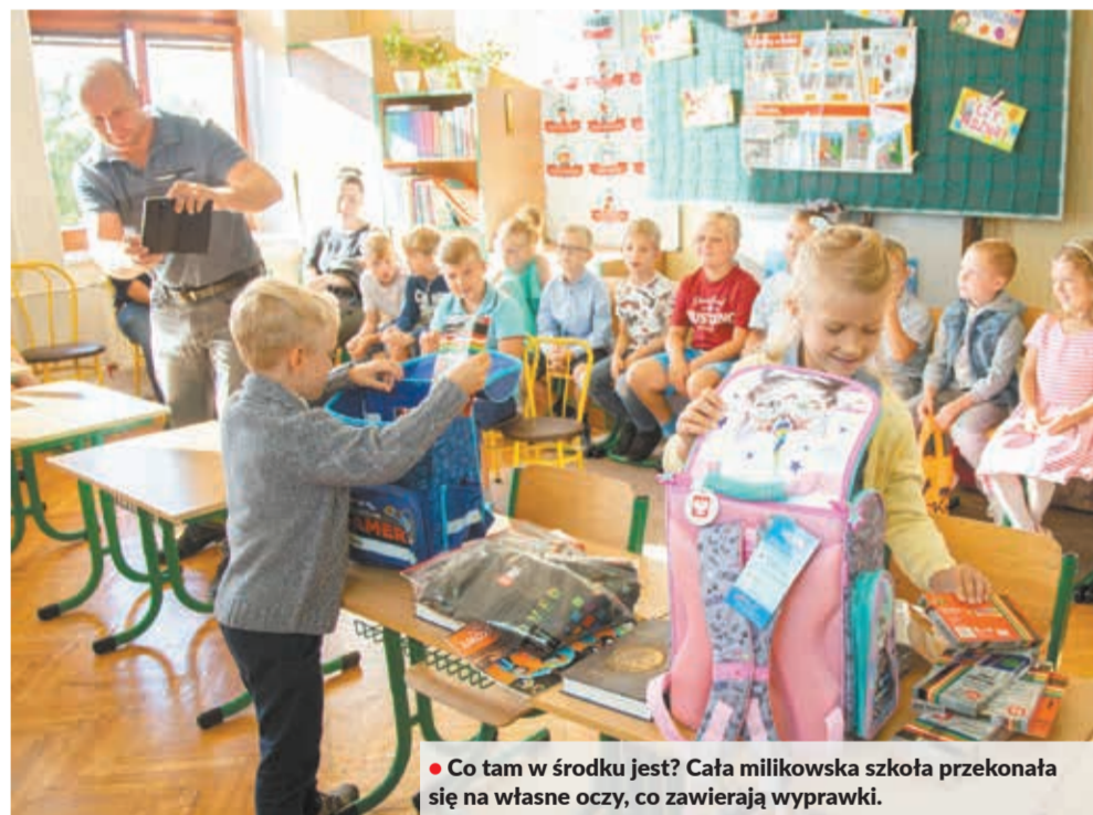
• Co tam w środku jest? Cała milikowska szkoła przekonała się na własne oczy, co zawierają wyprawki.