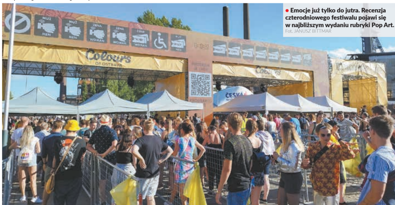
Emocje już tylko do jutra. Recenzja czterodniowego festiwalu pojawi się w najbliższym wydaniu rubryki Pop Art.

Skończyło się trzyletnie odliczanie do rozpoczęcia festiwalu Colours of Ostrava 2022. W środę w samo południe w industrialnej strefie Dolne Witkowice w Ostrawie ruszyła pierwsza po lockdownach edycja, która pierwotnie miała się odbyć w... 2020 roku.