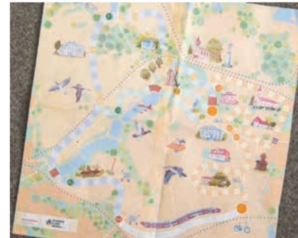
Projekt planisy do gry poświęconej Suchej Średniej i Dolnej. (dc)

współpracy z pastorem Januszem Kożusznikiem. Główne obchody 170-lecia pierwszej polskiej szkoły połączone z tradycyjnymi Suskimi Dożynkami odbędą się w niedzielę 4 września.