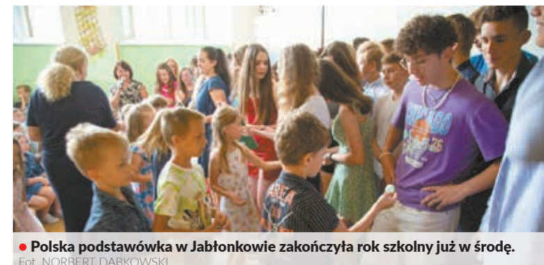
Polska podstawówka w Jabłonkowie zakończyła rok szkolny już w środę.

Uczniowie i nauczyciele frysztańskiej podstawówki pożegnali szkołę w ogrodzie. W cieniu drzew obejrzeli fragmenty programu klasy dziecięcej, przygotowanego na wieczorek pożegnania.