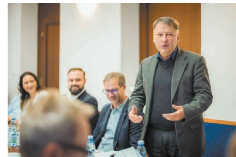
Vladimír Balaš został nominowany przez STAN na stanowisko ministra szkolnictwa.

Czeski rząd ma mieć od dziś nowego ministra. W fotelu szefa resortu szkolnictwa zastępuje Petra Gazdika za STAN jego kolega partyjny, specjalista w dziedzinie prawa konstytucyjnego i międzynarodowego Vladimír Balaš.