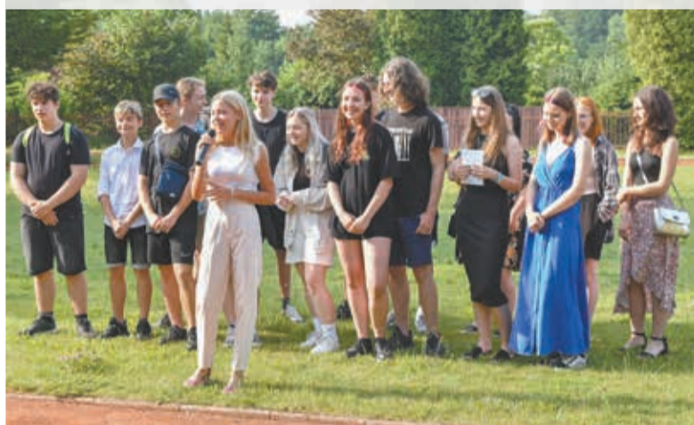
• Karwińska klasa dziewiąta żegna się ze szkołą.

Męskiego Grania Orkiestry 2019 „Sobie i wam”. Pięcioro dziesięcioklasistów odebrało z rąk Grażyny Roszki książeczki PZKO, a wspólne wykonanie utworu Haliny Kunickiej „Lato, lato, lato czeka” oznajmiło rozpoczęcie wyczekiwanych wakacji.