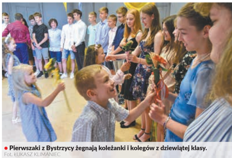
• Pierwszaki z Bystrzycy żegnają koleżanki i kolegów z dziewiątej klasy.

W bystrzyckiej polskiej szkole uczy się 179 dzieci. Aż 79 z nich zakończyło rok szkolny 2021/22 z