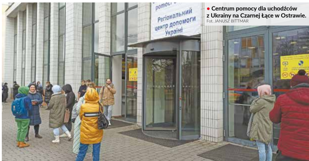
• Centrum pomocy dla uchodźców z Ukrainy na Czarnej Łące w Ostrawie.

PROBLEM: Republika Czeska wydała od początku rosyjskiej inwazji na Ukrainę 205 456 specjalnych wiz dla uchodźców z tego kraju. Dane te opublikowało wczoraj na Twitterze Ministerstwo Spraw Wewnętrznych. Liczba osób, które szukają tutaj schronienia przed wojną, sięgnęła już jednak 270 tys.