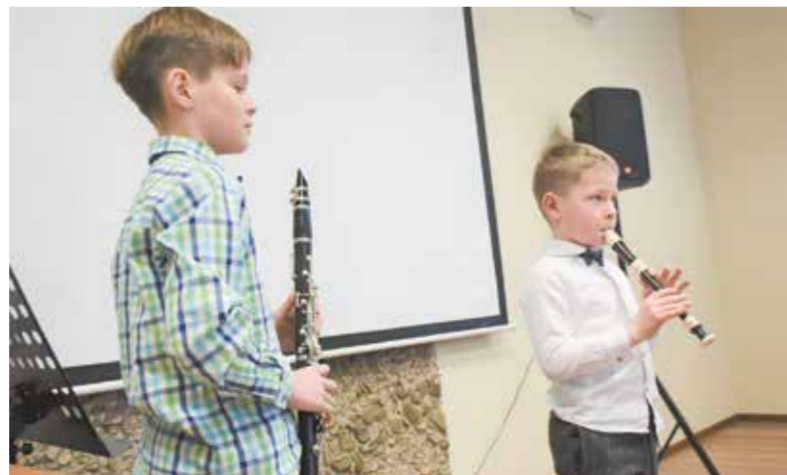
• Popołudnie umiliły muzyczne występy dzieci.

prezją działalność PZKO-wską znów rozpoczynamy – mówił w sobotę prowadzący imprezę Jakub Toman. Panowie przygotowali dla pań kwiaty, wykwinny poczęstunek, program muzyczny i filmowy. To już zresztą tradycja, że podczas obchodów Dnia Kobiet w Suchoj