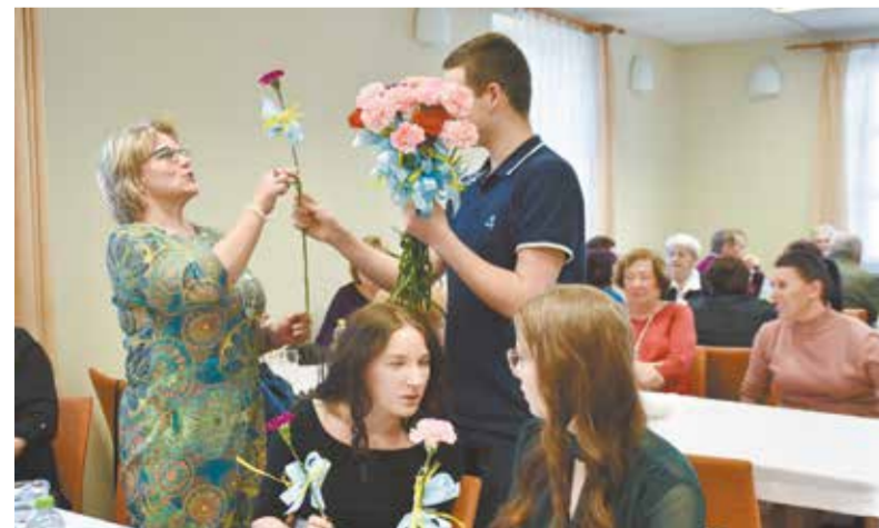
• Wszystkie panie i dziewczynki otrzymały kwiaty.

Obchody Dnia Kobiet były przed dwoma laty ostatnią przed pandemią imprezą Miejsowego Koła PZKO w Suchoj Górnjej. Tegoroczna edycja była natomiast pierwszym wydarzeniem o obudzowaniu obywateli. – Właśnie dzisiaj tą naszą im-