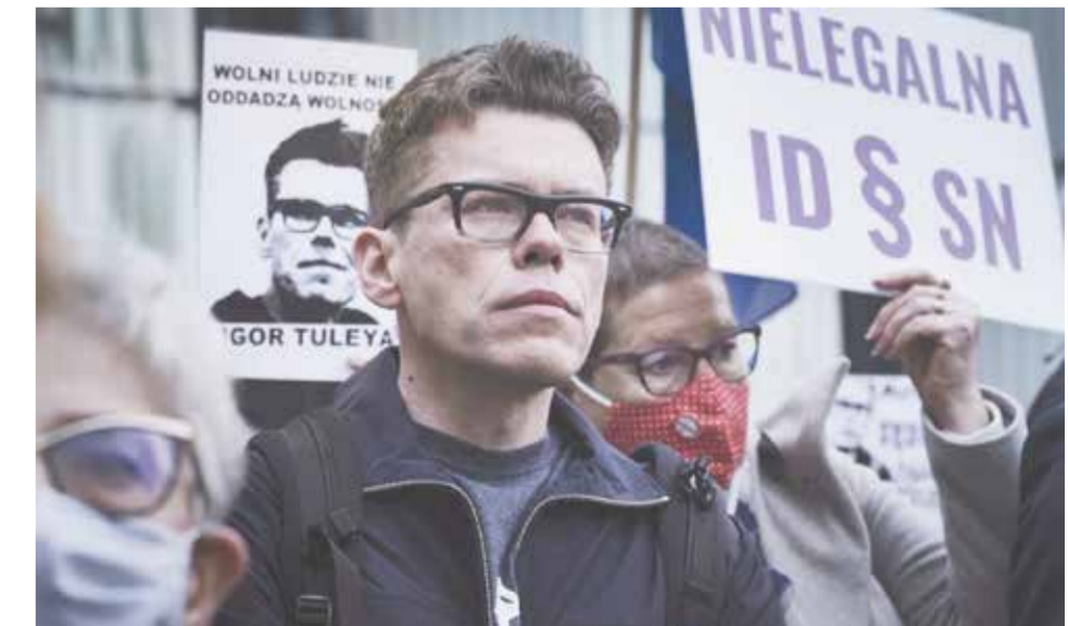
• Kadr z polskiego filmu dokumentalnego „Sędziowie pod presją”.

Filmy „Krymský poklad” (o ciągłym spore dotychczasym prawa własności do dzieła sztuki) oraz „Zatracená práce” (poruszający temat wolności mediów) przeniosą widzów na Ukrainę i do Rosji.