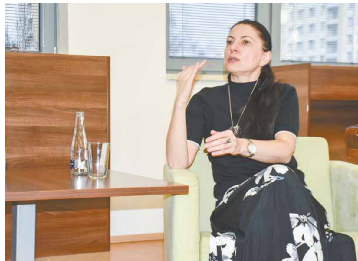
• Ałbena Grabowska opowiadała w czwartek o pisaniu, medycynie i swoich bułgarskich korzeniach.

Ałbena Grabowska – pisarka, lekarka, autorka sagi „Stulecie Winnych” zekranizowanej przez Telewizję Polską – gościła w czwartek po południu w Bibliotece Regionalnej w Karwinie-Mizerowie. Na spotkanie przyjechała z Brwinowa niedaleko Warszawy.