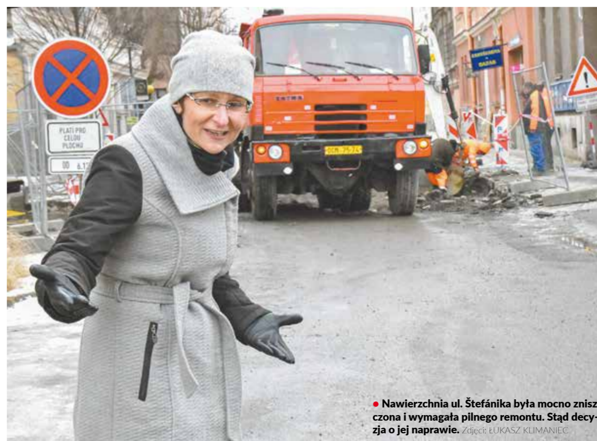
• Nawierzchnia ul. Štefánika była mocno zniszczona i wymagała pilnego remontu. Stąd decyzja o jej naprawie.

Korzystając z możliwości, jakie daje program dotyczący wymiany kotłów grzewczych, miasto wykorzystuje pieniądze na remonty w czterech pawilonach przedszkolnych przy ul. Grabińskiejk, których stan techniczny od lat dopominał