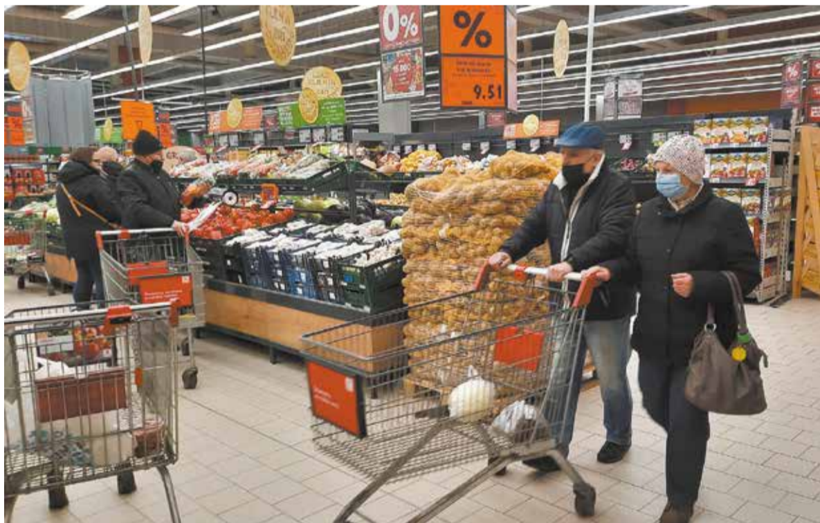
• Zerowy podatek VAT obejmuje w Polsce także owoce i warzywa.

Jadę do Zebrzydowic. Do stacji paliw Orlen stoi długa kolejka, kilkanaście samochodów. Tylko dwa mają polskie, reszta czeskie rejestracje. Nic dziwnego – paliwo było w Polsce tańsze już przed obniżeniem VAT, a teraz