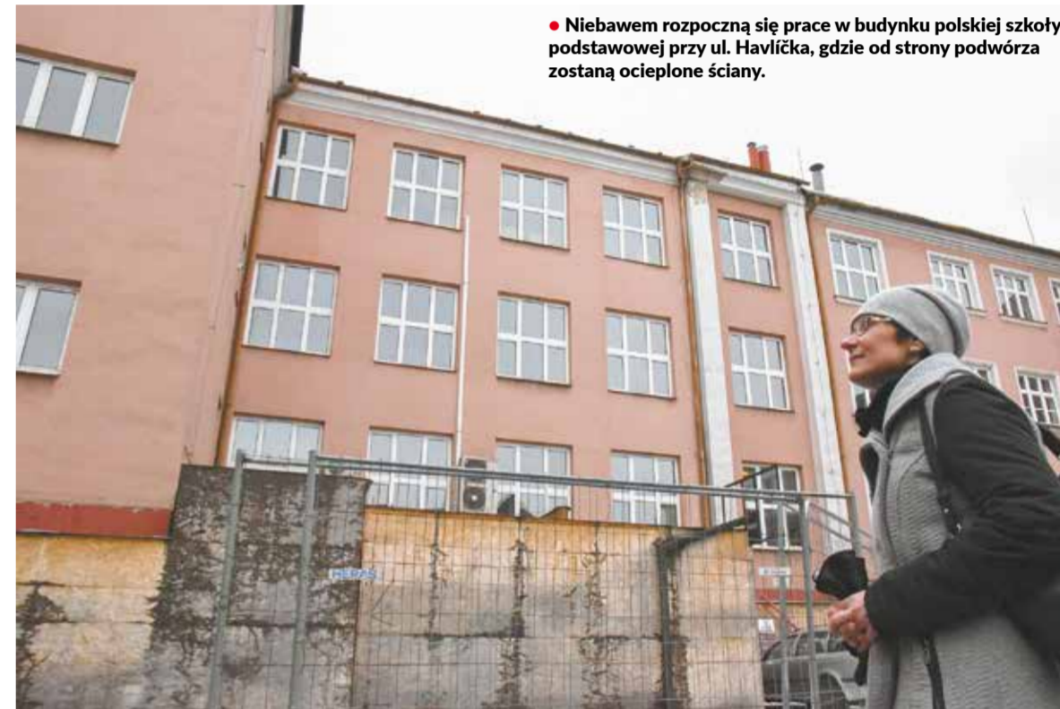
• Niebawem rozpoczną się prace w budynku polskiej szkoły podstawowej przy ul. Havlíčce, gdzie od strony podwórza zostaną ocieplone ściany.

się poprawy. Teraz modernizacja jest możliwa – to nie tylko wymieniana okien, termomodernizacja obiektu, modernizacja dachu oraz przebudowa instalacji wodnej, ale także remont łazienek i sanitariatów, z których korzystają