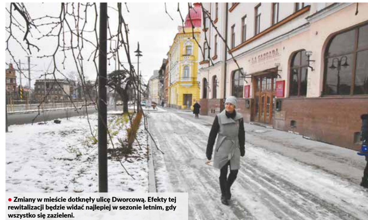
• Zmiany w mieście dotknęły ulicę Dworcową. Efekty tej rewitalizacji będzie widać najlepiej w sezonie letnim, gdy wszystko się zazieleni.