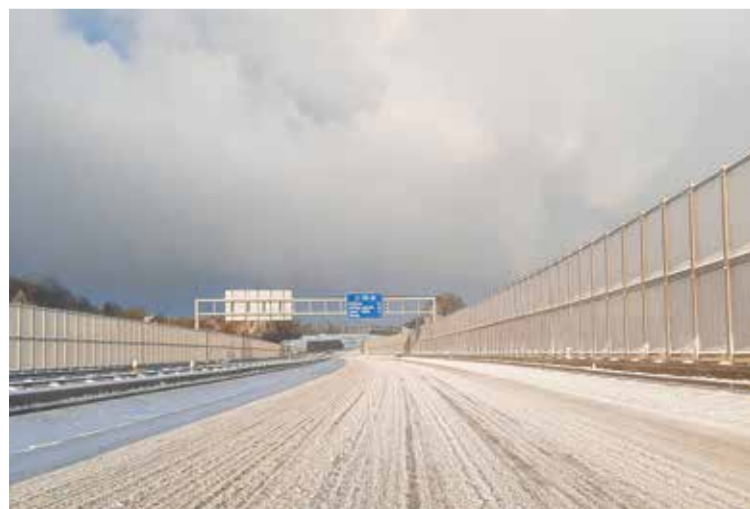
Tydzień temu pisaliśmy, że nie możemy narzekać na nadmiar śniegu. A dziś zmieniamy zdania. Na zdjęciu widać stan drogi I/11 - puchu spadło poprzedniej nocy dużo, kierowcy musieli zachować podwyższoną ostrożność.