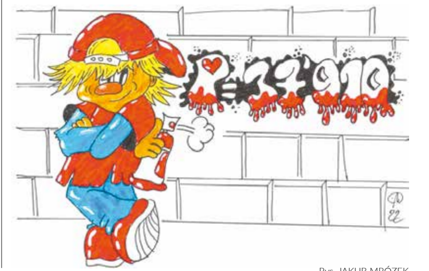
Rys. JAKUB MRÓZEK