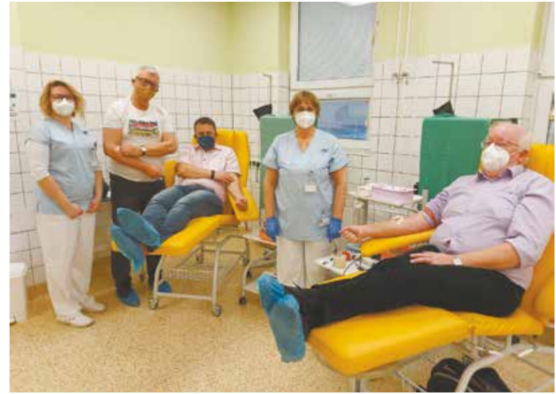
Pracownicy trzynieckiej placówki znowu oddali krew.

Jak ważna jest krew, mało kto wie lepiej od pracowników służby zdrowia. Wiedzą o tym doskonale także osoby zatrudnione w Szpitalu Trzyniec. Dlatego również w tym roku postanowiły kontynuować akcję honorowego krwiodawstwa.