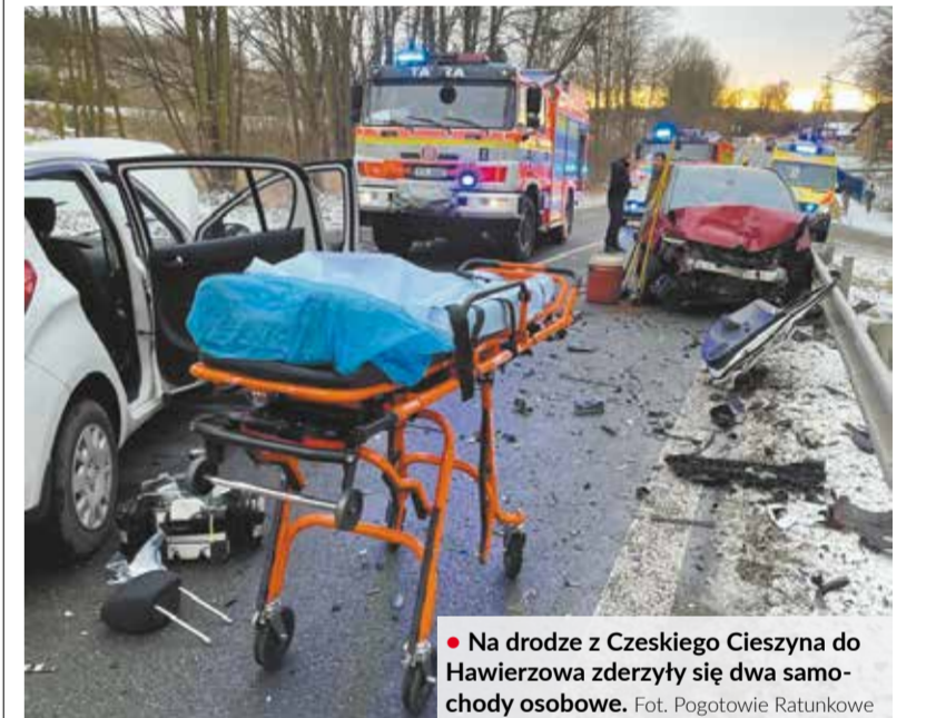
Na drodze z Czeskiego Cieszyna do Hawierzowa zderzyły się dwa samochody osobowe.

Jedna ofiara śmiertelna i co najmniej dwie osoby ranne - taki jest bilans zderzenia dwóch samochodów osobowych, do którego doszło w piątek po południu w Cierlicku Górnym, na drodze z Czeskiego Cieszyna do Hawierzowa.