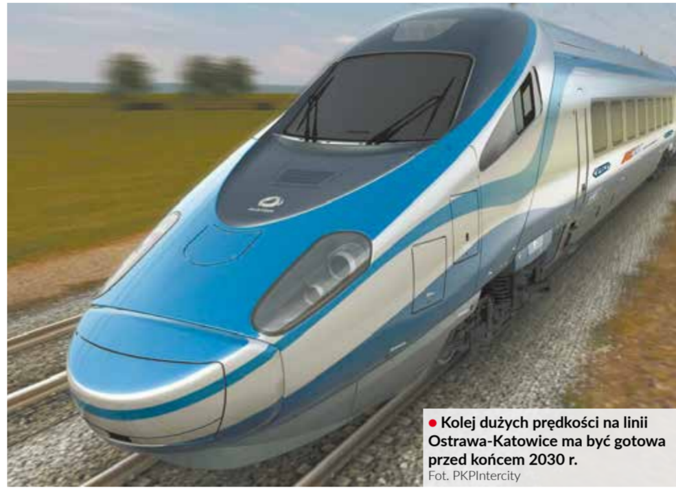
Kolej dużych prędkości na linii Ostrawa-Katowice ma być gotowa przed końcem 2030 r.