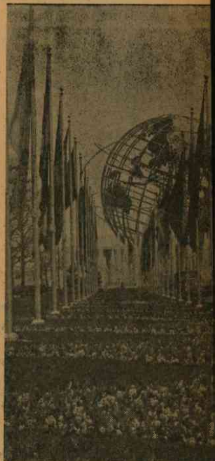
Ogromny globus na wystawie świat

GŁÓWNA SIEDZIBA ONZ mieści się w nowojorskiej dzielnicy Manhattan, nad brzegiem East River (Wschodniej Rzeki).