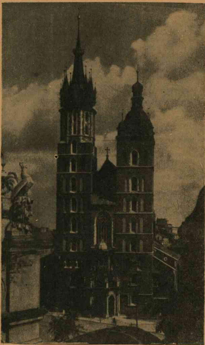
Kościół Mariacki w Krakowie

Jak przedstawia się sprawa budowania kościołów w chwili obecnej? — Aby na to pytanie odpowiedzieć, podajemy kilka szczegółów objaśniających jaki jest stan faktyczny w naszym kraju na tym polu.