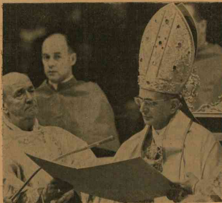
W czasie uroczystej sesji plenarnej Ojciec św. Paweł VI promulgował 5 schematów definitywnie przyjętych przez Ojców Soboru.

okólnika w r. 1957 i w latach następnych aż do 1960, Rady Narodowe na 25% takich podań odpowiadały pozytywnie i to gdy chodziło o małe roboty i pilne naprawy, rzadziej pozwalano na budowę nowego kościoła. Ale w r. 1960 nagle cofnięto już wydane pozwolenie na budowanie nowych świątyń, co oczywiście naraziło wiele parafii na dotkliwe szkody materialne i moralne.