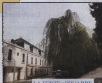
LA FERTE s/JOUARRE

Domy Europejskiego Centrum Formacji Świętorodzinnnej we Francji