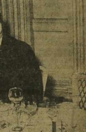
Na bankietu prasy zagranicznej, na którym premier Chamberlain wygłosił znaczący przemówienie o przeliczeniach i ustroju politycznym.