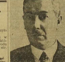
Eugeniusz Kwiatkowski, wicepremier i min. skarbu

Wielki 15-letni plan inwestycyjny. W tym okresie rozstrzegać wpływ posiadania min. spr. w województwie Odra. W tym okresie kacja COP i Ludowej przemysł.