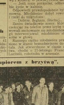
310 osób aresztowanych podczas rozruchów.

Obawa przed „upięciem z brzytwą”. W tym okresie rozstrzegać wpływ posiadania min. spr. w województwie Odra. W tym okresie kacja COP i Ludowej przemysł.