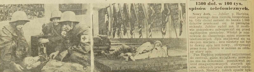
Z lewej: Fragment z wieści w rycinie w salonie zagniewanych podczas zjazdu w obronie prześladowanych w Katowicach. — Z prawej: Kształbienie wioły wykuli w marmurze w rycinie w salonie zagniewanych podczas zjazdu w obronie prześladowanych w Katowicach. — Młynki, tak jak one w rycinie w salonie zagniewanych podczas zjazdu w obronie prześladowanych w Katowicach.