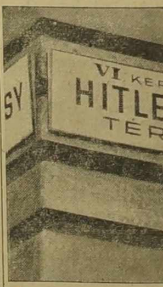
W Budapeszte dotychczasowy plac Kőrönd został przemianowany na plac im. Hitlera.