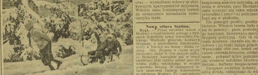
W Rumunii spadł w dniach ostatnich obfity śnieg. — Zdjęcie przedstawia wyżej wykonano w okolicach Bukaresztu w dn. 23 października rb.

Związane szczerze kobiety, pod silną strażą, odstawił do więzienia, są „sprawdliwie” stało się zadość.”