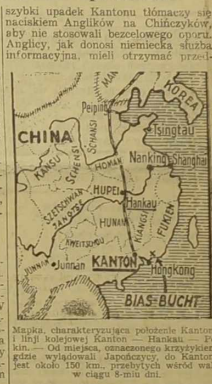
Mapka charakterystyczna południowej części Chin. Na linii kolejowej Kanton — Hankau — Peking, w kierunku południowym, znajdują się następujące punkty: Kanton, Hankau, Peking, Tientsin, etc.

Prasa faszystowska bronie stanowiska Węgier, a nie chce zrażać siebie Niemców — stara się wykazać, jakoby niezależność Rusi Podkarpackiej leżała w interesie Sowieców. Jest to jednak bardzo wątpliwe. Wskazywać może zależność polityczną i polityczną, która powstaje między Włochami a Niemcami.