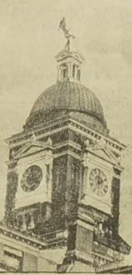
„Strzelek okupacyjny” na wleży ratusza...