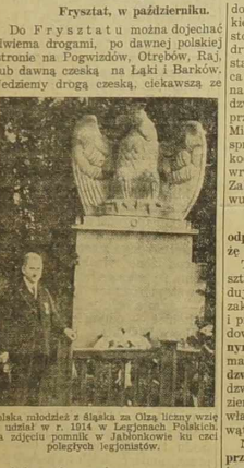
Polka z rodziną w świątyni. Na Olaj liczący wiek ma u siebie w r. 1914 w Legionach Polskich. Na zdjęciu pomnik w Jabłonkowie ku czci polskich legionistów.

Względu na imponujący przemarsz obywatelstwo polskie oddzieliło wojskowi, różnych rodzajów broni.