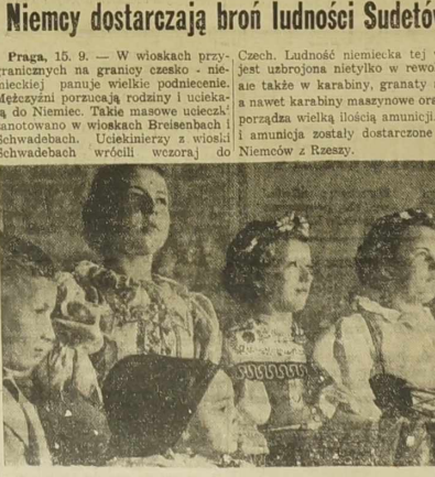
Cy iow ucauroni te matose Czeskiej przed najazdem zbrojnym na ich ojczyznę!

Czech. Ludność niemiecka tej wioski jest uzbrojona nietylko w rewolwery, ale także w karabiny, granaty ręczne i nawiękarabiny maszynowe oraz rozporządza wielką ilością amunicji. Broń i amunicja zostały dostarczone przez Niemców z Rzeszy.