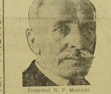
Prezydent R. P. Mościcki.

Warszawa, 14. 9. - W życiu wewnętrznym Polski zaszedł wczoraj fakt niezwykle doniosłości. Zupełnie nieoczekiwanie dla szerokiego