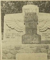
U niedzieli nastąpi w Lesse pod Alilly obłożenie pomnika ku czci Poległych 1217 poległych na miejscu t. zw. 'Tranche de Bois' (topy wojenna). Na zdjęciu od strony lewej.

W jaki sposób poprzec wielką Turcy Polskiej iem. PKO w Lille.