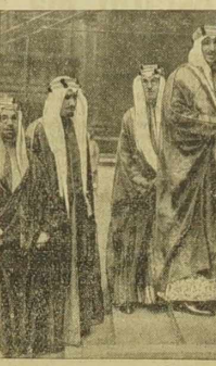
Do Londynu przybył arabski następca tronu Emir Szad (z prawej). Królewicza w stroju arabskim widzimy w przedskoku ministerstwa spraw zagranicznych, gdzie na jego cześć lord Halifax wykonał toast.