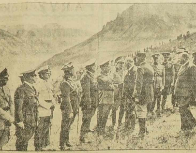
W podporządkowaniu atłackim wojska francuskiego w Alpach wzięli również udział atłackie wojska państw obcych. Na zdjęciu Prezydent Republiki wita się z przedstawicielami państw obcych. Cztery odlewki: 1. Polacy, atłackie wojska polskie.