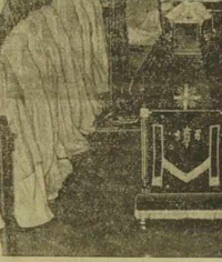
Urwane na biało i nabłościo strazy zakonu „Młokosz Szar, Magli” w Sidney, w Australii, i trzymają straż żałobną przy zwłokach zmarłej zakonnicy.