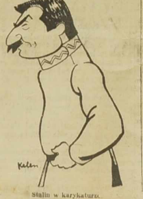
Stalino w karykaturze.

Wiedomości z Wiednia, nie brzmiały pomyślnie. Nie jednak, że polityka wiedeńska, opierająca się na „Mittelengländ”, wychodzi w odciskach nieregularnych, mniej więcej dwa razy na tydzień i rozsyła się go do wszystkich dawniej bojących a dzisiaj zawiedzionych zwolenników anarcho - bolszewickich. — Głównymi wizerunkami są Anglia i Austria, które przysięgły, że nie będą wrogi, b. nazich austriackich, o tym świadczą także np. zdania: — „Nie chcemy, aby traktowano Austrię jak zdobytą prowincję. — Celem naszych działań jest jednoczenie Austrii z Rzeszą, lecz wnieść nie kraju pod jarzmo panowania pruskiego. — Chcemy sami zarządzać naszą Austrią”.