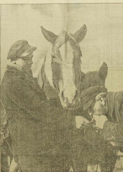
Po skończonej dniuwe na polu.

A więc to było wywołanie Odety! To był nagle królowej cyganków! „A nakoło ani żywej duszy! Konie zostały prawdopodobnie wyprzeżnięte i pasły się gdzieś niedaleko, obok jakiegoś strumyka. Rouletabille czuł się na czwor-