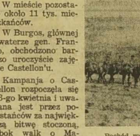
Pochód wojsk powstańczych w stronę Castellón.

h. podlegających mu. Należąca do sprawy Chłopskiej Rewolucyjnej. (Zob. „Nowej Rzeczypospolitej”).