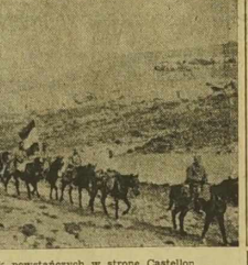
Pochód wojsk powstańczych w stronę Castellón.