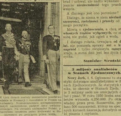
W tych dniach zostały zamienione poselstwo polskie w Rumunię i rumuńskie w Polsce na Ambasady. Nowomanowani, ambasadorscy, którzy nie przystępują zarząd powiatowe go Stronictwa Ludowego oskarżeni o że w sierpniu 1934 roku, w związku z tym, mającym na celu obłudzenie b. wojkami dróg publicznych.

— „nie można zrealizować wielkich i wielkich planów państwowych w społeczeństwie całkowicie rozproszonym i powąszonym...”