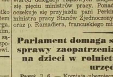
Parlament domaga się od rządu zatłoczenia sprawy zaopatrzenia na starość dodatków na dzieci w rolnictwie i poprawy pensji urzędniczych