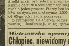
Mistrzowska operacja chirurgiczna