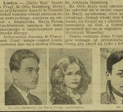
Ks. Otto Habsburg i ks. Maria Teresa Liechtenstein.