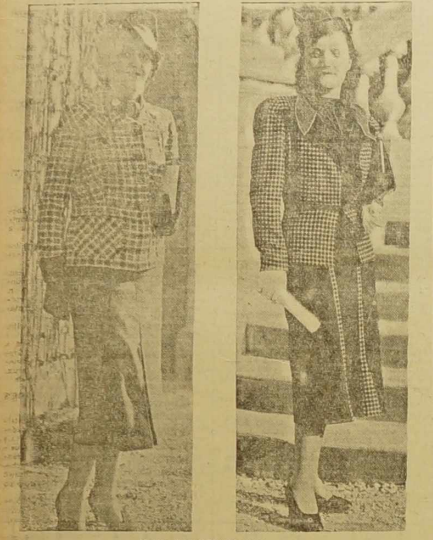
Modne komplety wiosenne.

Wzrostają w niej wszystkie siły natury. Wzrostają w niej wszystkie siły natury. Wzrostają w niej wszystkie siły natury.