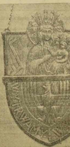
Powyszej zamieszczony zdjęcie przedstawia ryngraf, który odegrał światowego Zw. Polaków w Niemczech na kongresie w Berlinie. U góry widoczny jest ryngraf widoczny polobna Matki Boskiej Częstochowskiej, między innymi „Rodła” biskupa godem Związku Polaków w Niemczech. U dołu - Grzes Polaki, w okolicy którego został wyrywany napis „Wyrwany i wyrwany” (z rodu Związku Polaków w Niemczech). Na odwrotnym stronie ryngrafu znajduje się napis - „Związek Polaków w Niemczech w 15-letnie rocznicę walki o Polskę” - światowy Związek Polaków w Zagranicy, 6. III 1933 r.