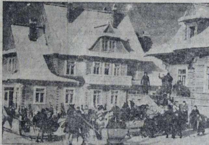
Częściowy widok budynków Ośrodka Wychowawczego w Groniku.

W dn. 23 b. m. odbyło się w Groniku, w gminie kościeliskiej, pod Zakopanem, uroczyste poświęcenie Ośrodka Wychowawczego Związku Polaków z Zagranicy.