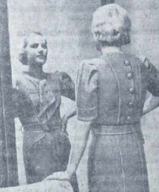
Model wiałnianej sukienki wiosennej.