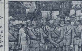
Sokol amerykańscy chętnie odwiedzają Polskę.