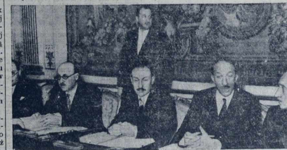
Z posiedzenia rady ministrów. — W środku p. Chautemps.

Doumergue 8 miesięcy i 29 dni; Dalandier 8 miesięcy i 24 dni; Poincaré 8 miesięcy i 18 dni; Laval 7 miesięcy i 18 dni; Flandin 6 miesięcy i 23 dni