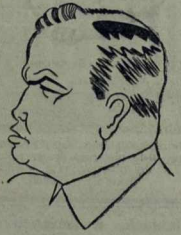
Maurycy Thorez, przywódca komunistów.

Rozpoczęły się zwykle w takim wypadku narady Prezydenta z marszałkiem Parlamentu i Senatu. Pan Le-