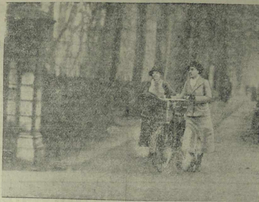
Można się o tem przekonać choćby z powyżej zamieszczonego zdjęcia. Oto królowa holenderska Wilhelmina (z lewej) uduje się rzu do pałacu w Soestdijku, gdzie przebywa ks. Juljana.