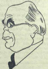
Albert Sarraut, były minister stanu.

Natomiast prawo moralne do wykonywania władzy w kraju ma tylko ten,