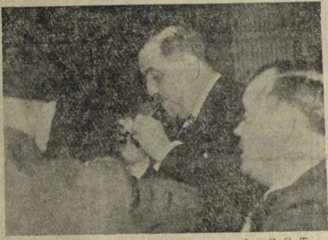
Leon Jouhaux (w środku) sekretarz generalny C. G. T.

Paryż 8. 1. — Cała awaga rządu jest w chwili obecnej poświęcona sprawie zatargów pracy, których liczbę postanowił rząd bezwarunkowo zmniejszyć. Stosownie do ogłoszonego wczoraj oświadczenia, premier Chautemps wystosował listy do organizatorów pracodawców i pracobiorców, zapraszając ich na wspólną konferencję, jaka odbędzie się w środe 12 b.m. w siedzibie rządu.