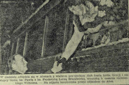
W niedzielę odbył się w Atenach z wielkim przepychem ślub...