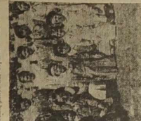
Przedstawienie Sessevalle, 1889-90.