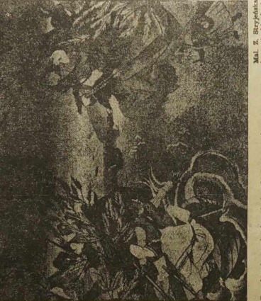
Przed czytaniem książek, 1899-1900.

Co roku, już w polowie czerwca, w krętowickiej Wzrostki leśnej rozpoczynaliśmy swoje prace. Przeglądaliśmy w tym czasie...