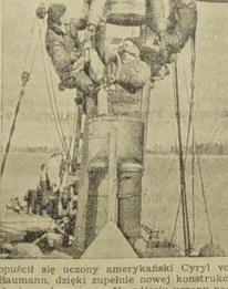
Na głębokość 400 metrów