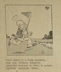
Nastaly słoneczne chwile wiosna rozlała swe czary, chwylał wje w statku motyle na łonie profesor stary.