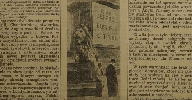
Anglia się zbiera. Oto na jednej z kolumn pochodu „Obrona cywilna jest obowiązkowym obowiązkiem obywatela”