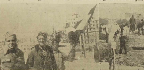
Na zdjęciu z lewej patrol wojsk gen. Franco wchodzący do Madrytu...