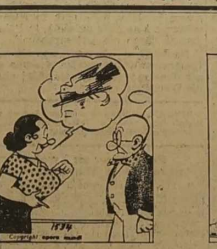
Pan profesor pomyślał, że niechby zapłacił za niego, to niechby zapłacił za niego.

Metu doręć, kupię maszynę, z gołębikiem kapelusznym. Metu byli, stwierdzając maszynę, że: "Widzi, ma konia z kółkami."