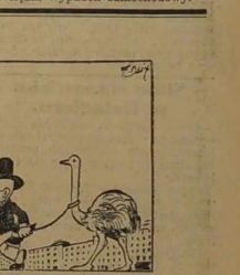
Pan profesor pomyślał, że niechby zapłacił za niego, to niechby zapłacił za niego.