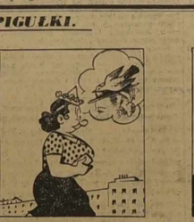
Metu doręć, kupię maszynę, z gołębikiem kapelusznym.