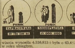
ZAKOPIE MILKA WZROSTA.

Również niegła znacząco powiększyła suma przeznaczona na dożywianie dzieci bezrobotnych. Łość dzieci w przeliczeniu na miesięczny okres dwo-