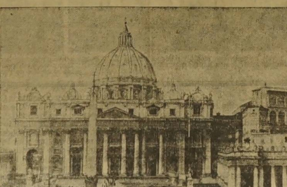
Bazylika św. Piotra w Rzymie, w której Piusz X-go został pochowany.

Rzym, 15. 2. - Wczoraj popołudniu, podług ustalonego od wieków ceremoniału, nastąpiło złożenie do podziemi bazyliki św. Piotra trumny ze zwłokami papieża Piusa X-go, który spoczął w wieży sanktuarium imienia św. Piusa X-go.