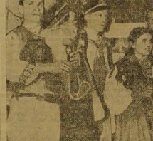
Fotografie zdjęcie z wielkiego tradycyjnego lału polskiego w Nowym Jorku...