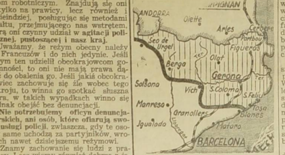
Mapka dzielnic wojennych w półn. Katalonii. Front przeszedł się już pod Figueras. Tama wody...