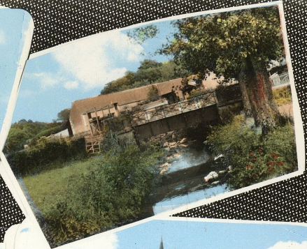
VANCÉ 72. Sarthe