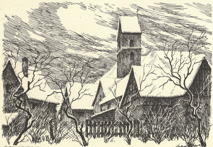
BRUNSTÄTT EN HIVER.